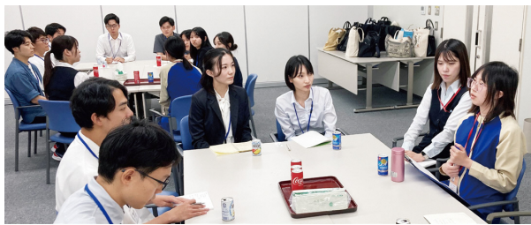
全国の学生が富山県内製薬企業で研修