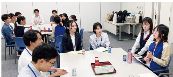
全国の学生が富山県内製薬企業で研修

合わせて、県内製薬企業の社会人向けに、製造技術や品質保証・管理の向上に資する研修を継続して行っており、これらの取り組みにより、持続的な人材基盤の強化を推進しています。