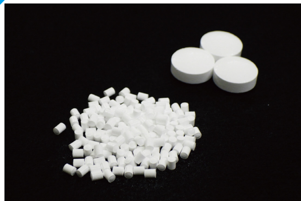
試作したミニタブレット(左)と一般的な錠剤

小児や高齢者でも服用しやすいように、直径約2ミリのミニタブレット製剤の開発に取り組んでいます。